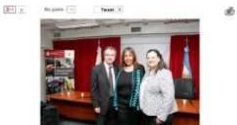
La oficina de Identidad de Género y Orientación Sexual propone acciones e iniciativas orientadas a promover las carreras de acceso a la justicia que afectan a LGBTI, hombres trans e intersexuales y contribuir a visibilizar, prevenir y erradicar la discriminación de quienes experimentan identidades de género y sexualidades no normativas, tanto en el sistema de la justicia como en relación con la atención de sus receptoras.