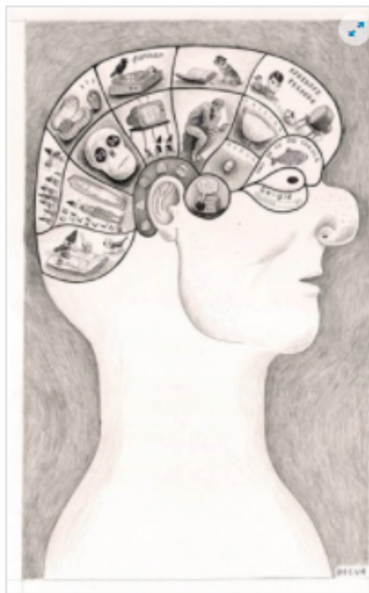
Ilustración: D. Cur.

¿Fase la filosofía por un buen momento en su relación con la esfera pública? Como siempre que hay filósofos involucrados, depende de a quién se le pregunta. En medios gráficos, blogs y redes sociales pueden leerse a diario lamentos más o menos justificados sobre la pérdida de peso de la voz de los intelectuales, y en particular de los filósofos. El sistema académico incentiva a los filósofos a escribir papers para seguir en carrera; el libro propio, más que la entrada al mundo intelectual, es hoy un lujo que pueden darse los que ya tienen asegurada su permanencia en el sistema. Esto, sumado a la creciente profesionalización y especialización alentada por el mismo sistema, genera que los filósofos se conocen cada vez más con sus pares y menos con personas de otras esferas. La necesidad de ingresar en la academia a una edad relativamente temprana (el doctorado ya no es, tampoco, una obra cumbre de veinte años de carrera, sino más bien la presentación en sociedad) les dificulta a los filósofos el contacto con otros ámbitos sociales: ya casi no quedan filósofos que hayan trabajado en hospitales de guerra de como Wittgenstein o tocado el piano con Leonard Bernstein como Donald Davidson.