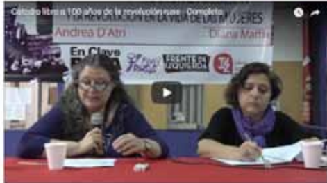
Cátedra Libre a 100 años de la revolución rusa - Completa - YouTube