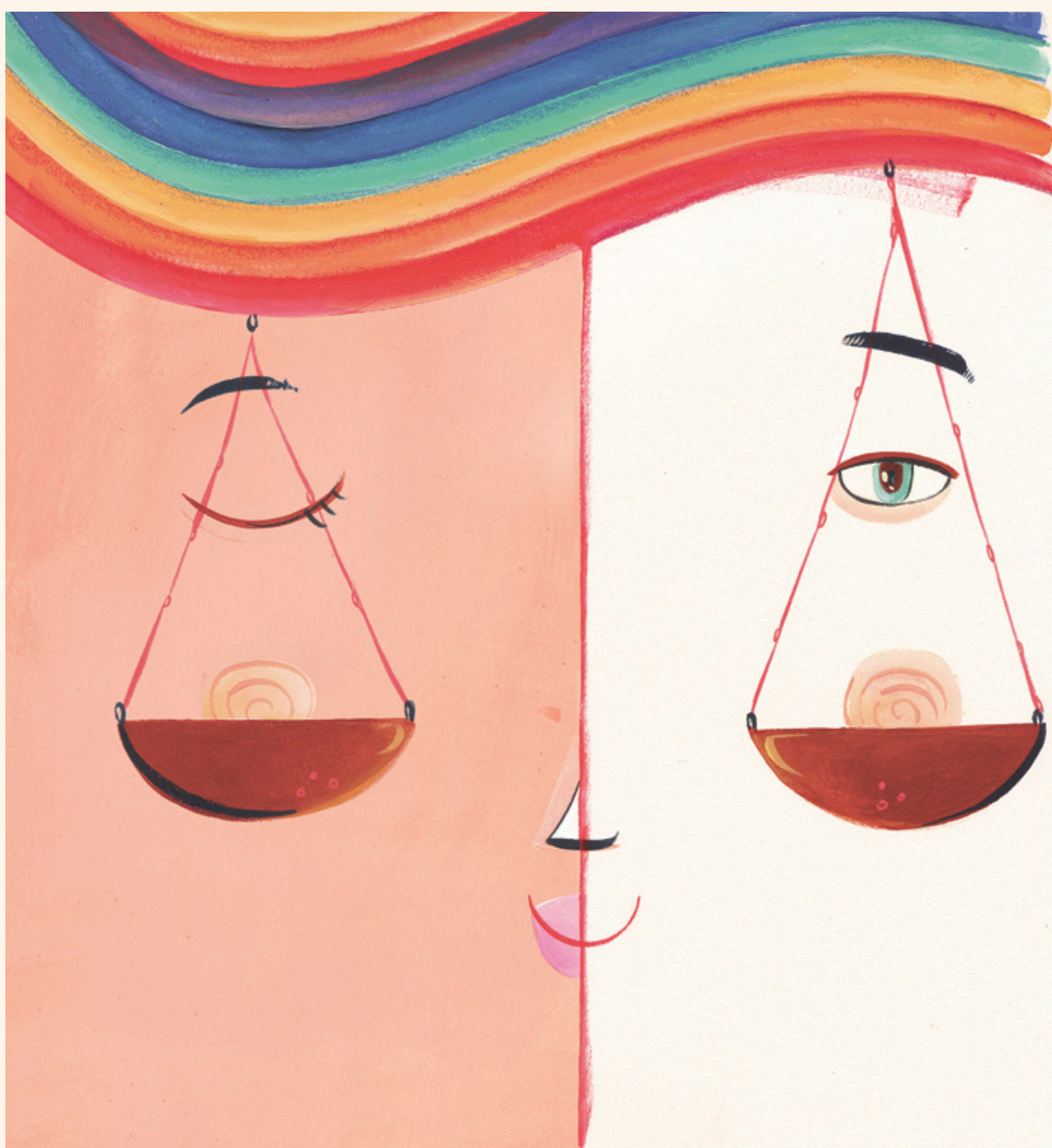
Ilustración: Ana Sanfelippo