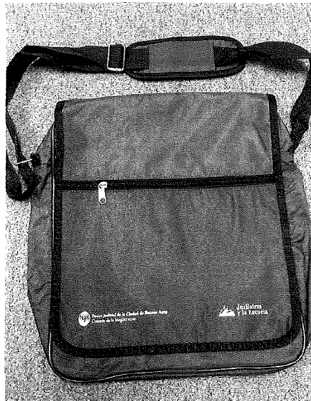
Imagen del morral:

Logos en color blanco (según imágenes al pie)