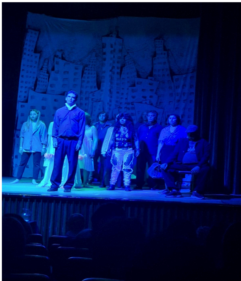
Foto de una escena de la obra de teatro presentada en la semana de la discapacidad "Nuevas historias para ser contadas y a veces cantadas" del grupo de teatro "Entrelazarte", visibilizando la temática de Salud Mental y promoviendo la desmanicomialización.

Promoviendo la diversidad y la convivencia