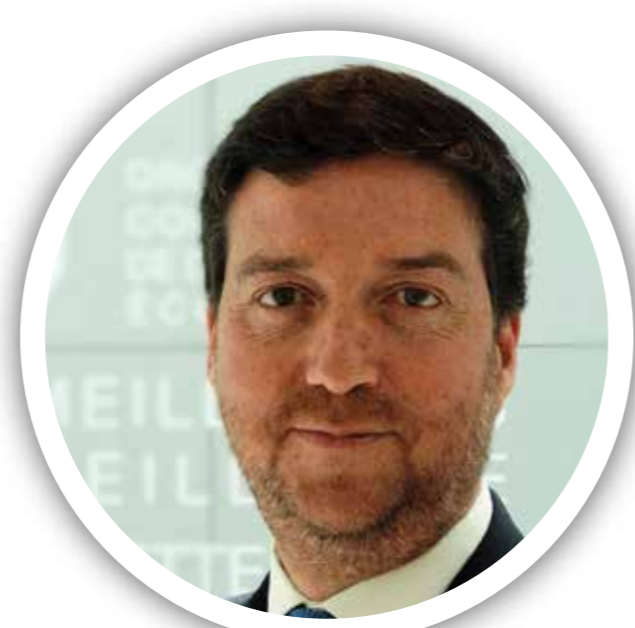
Paulo Magina Subjefe de la División de Infraestructura y Contratación Pública en la Dirección de Gobernanza Pública de la OCDE